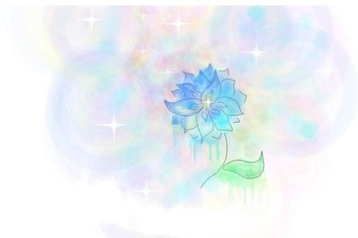
Рисунок 1 – Пример оформления рисунка

Примечание. Текст рисунка оформляется шрифтом Times NR, 10. Цвет диаграмм и графиков – черно-белый.